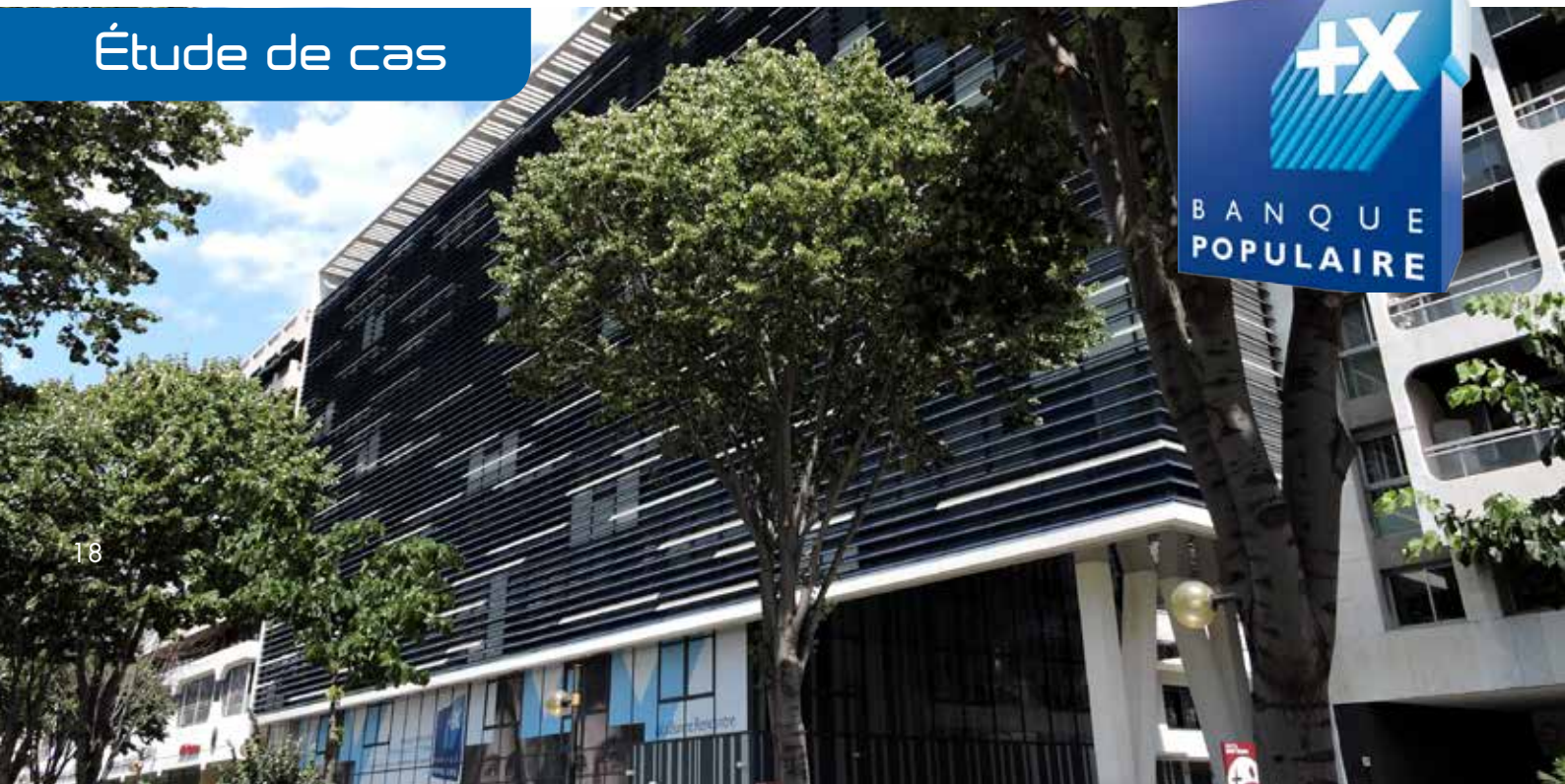
Banque Populaire Provençale et Corse - Siège Social, Marseille, France

Le constructeur innovant STid et son partenaire intégrateur Unicacces ont été sélectionnés par la Banque Populaire Provençale et Corse (BPPC) pour leur solution de contrôle d'accès sécurisé multi-applicatif.